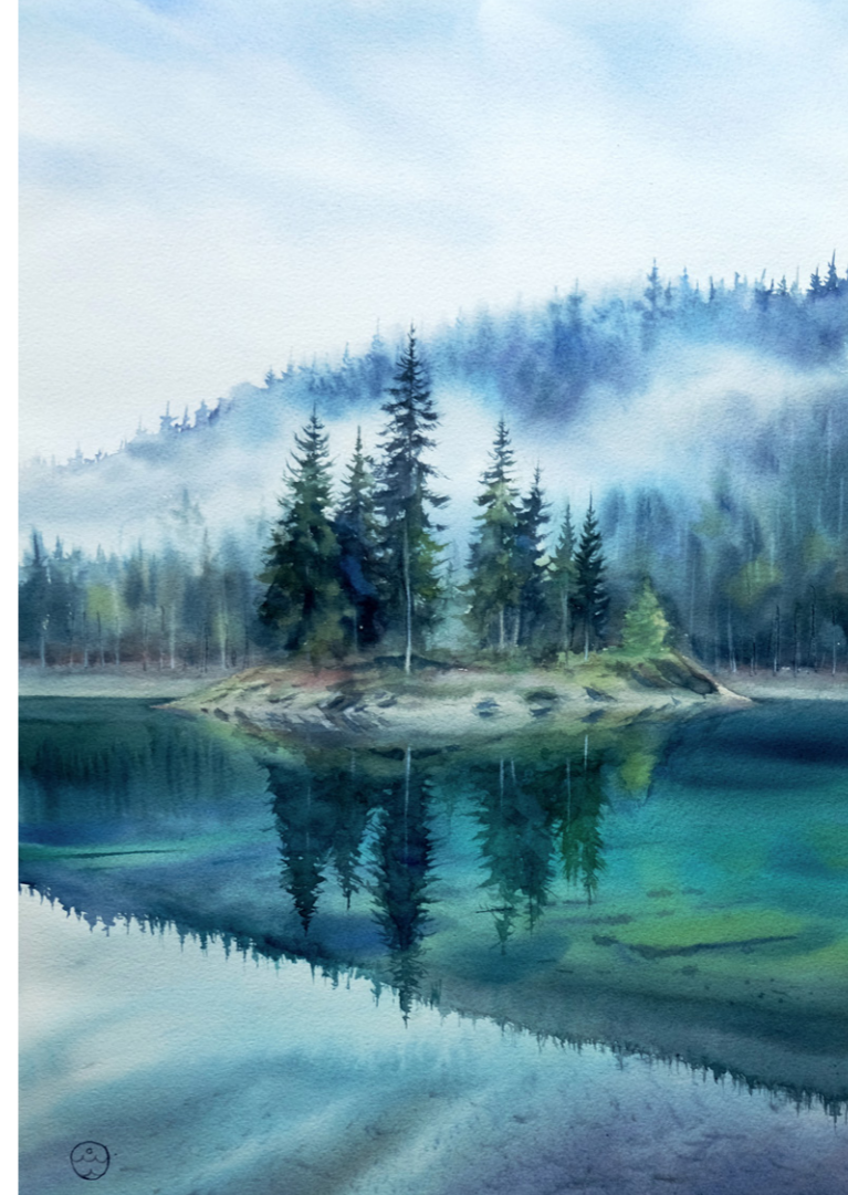
Туман над островом. Акварель, 38x56 см