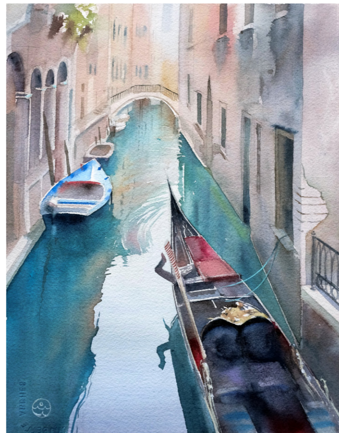
Моменты Венеции. Акварель, 30x23,5 см