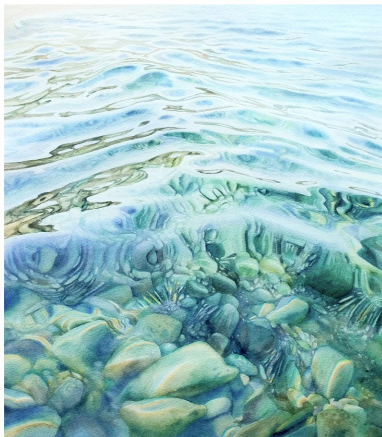
Сокровища подводного мира. Акварель, 41x36 см