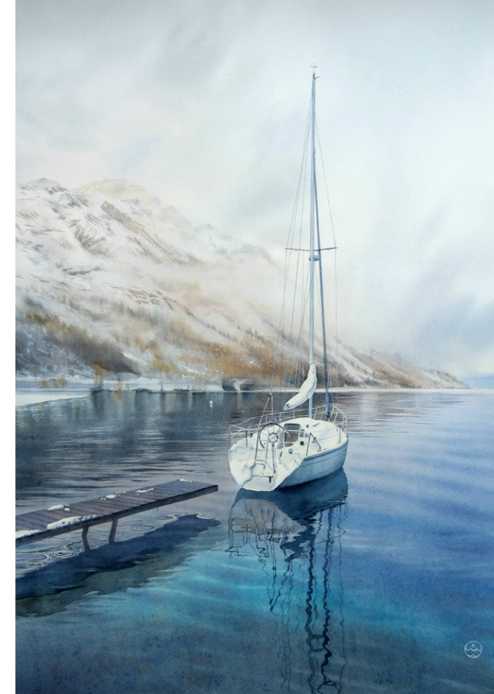
Северный колорит. Акварель, 72x51 см