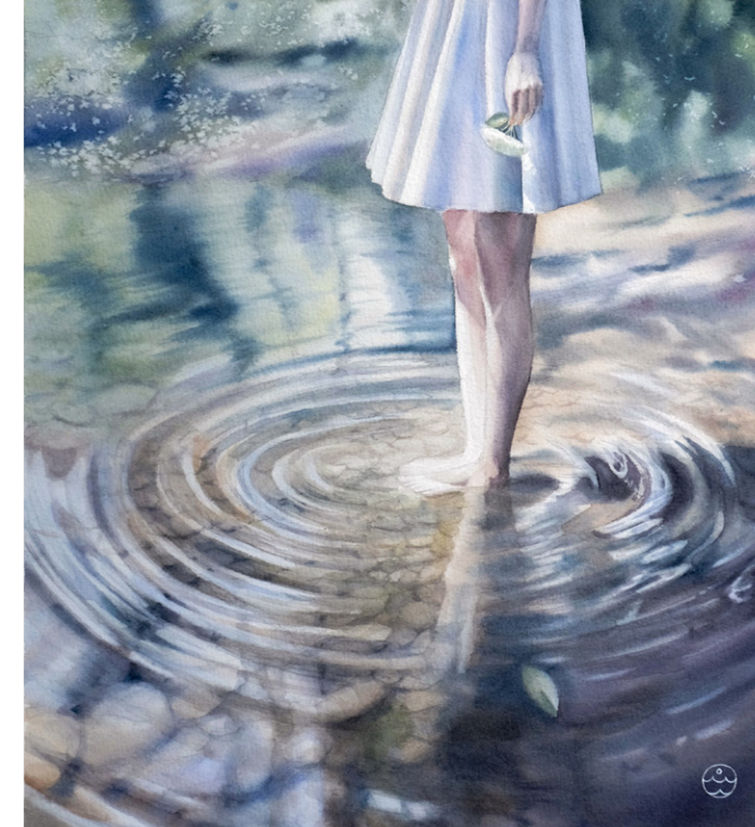
Разговор с водой. Акварель, 40x35,5 см

Я не состою в Союзе художников России, Союзе Акварелистов России или других официальных сообществах. Желание возникало, но сейчас я не ощущаю потребности, возможно, все впереди. Гораздо важнее для меня неформальные сообщества, дружеские связи, которые сложились с коллегами-художниками и моими учениками онлайн и офлайн. Многие художники-акварелисты знают друг друга, вместе подают заявки на выставки, восхищаются удачными работами, подбадривают и поддерживают, когда возникают трудности. Я знаю, что можно обратиться за помощью и советом и мне постараются помочь. Так же поступлю и я. Общение в основном происходит в соцсетях, но с некоторыми товарищами-художниками мы успели познакомиться лично. Мне важно поддерживать своих учеников, это тоже целое сообщество. Для многих из них я стала первым проводником в мир акварели. В начале пути иногда возникают растерянность